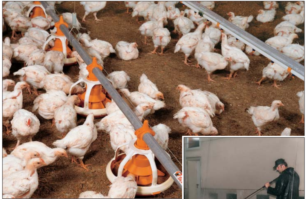
FLUXX 330 mit Taschenteller und 5-arm Grill