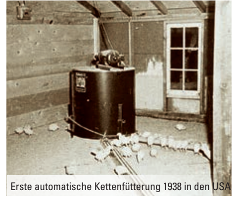
Erste automatische Kettenfütterung 1938 in den USA

– ist geblieben. Das Gesamtsystem wird jedoch ständig verbessert und an die heutigen Anforderungen einer modernen Geflügelhaltung angepasst. Die Big Dutchman-Futterkette CHAMPION ist universell einsetzbar, in der Käfighaltung für Lege-Elterntiere, Junghennen vom ersten Tag an und Legehennen. In der Bodenhaltung für Broiler-Elterntiere und natürlich in der alternativen Legehennenhaltung.